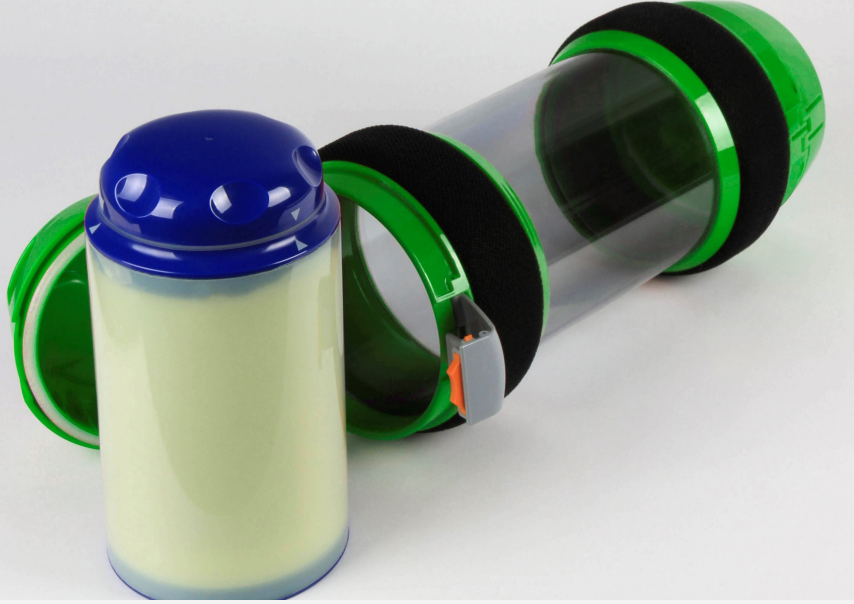
Laborbehälter mit temperaturisoliertem Innenbehälter