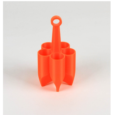
Inlay für einzelne Probenröhrchen