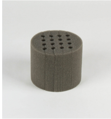
Schaumstoffinlay für Probenröhrchen