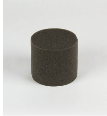
Sicherndes Schaumstoffinlay groß