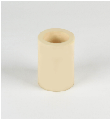
Schaumstoffinlay für 0.25 l Glasflasche