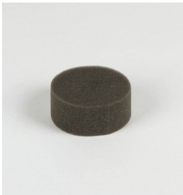
Sicherndes Schaumstoffinlay klein