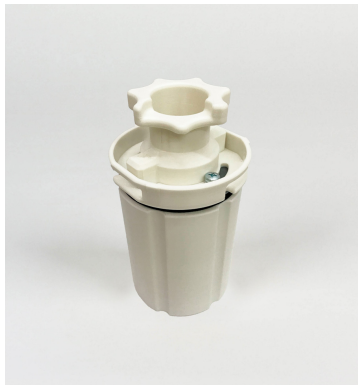
Kundenindividuelles Inlay (Beispiel)