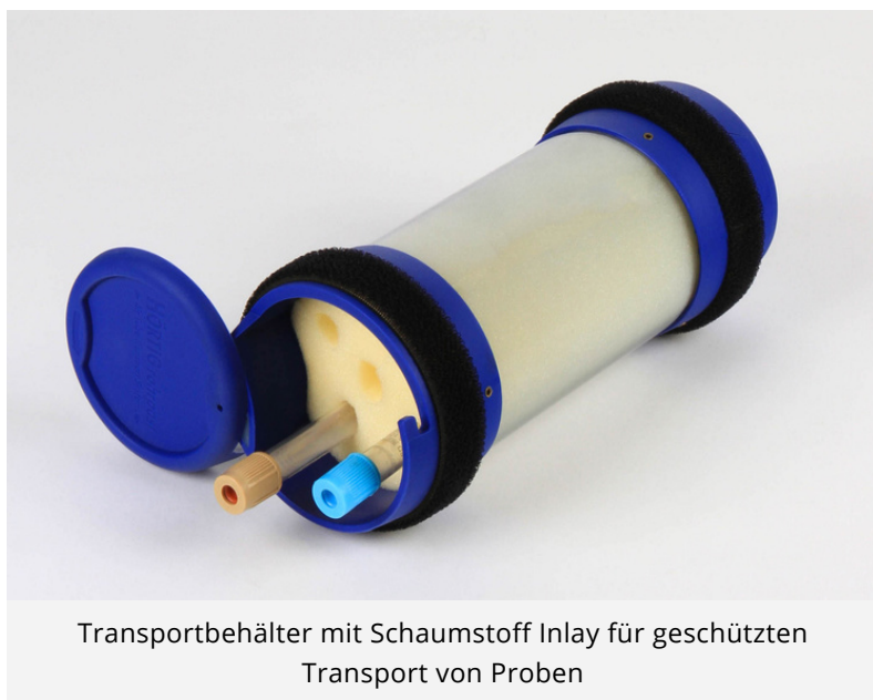
Transportbehälter mit Schaumstoff Inlay für geschützten Transport von Proben

4. Inlays: Haben Sie Inlays, z.B. für das Verschicken von Blutproben? Prüfen Sie auch diese auf Abnutzung und Beschädigung. Im schlimmsten Fall werden die verschickten Gegenstände durch Beschädigung unbrauchbar und der Rohrpostbehälter muss aufwendig gereinigt werden. Bei Bedarf können Sie die Inlays ganz unkompliziert bei uns nachbestellen.