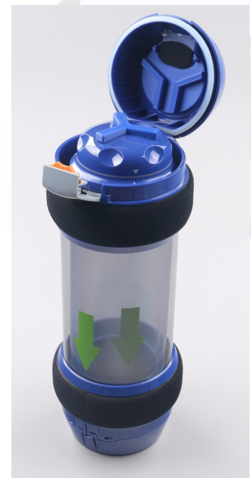
Auslaufsicherer Zytostatika Transportbehälter