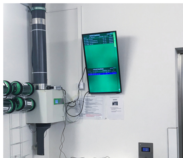
Kombinierter kleiner Bildschirm im Krankenhaus

Neben der automatischen Rücksendung eines nicht abgeholt Behälters können gesicherte Sendungen auch manuell zurückgeholt werden. Da die Mitarbeitenden über den Info Screen sehen, ob der Behälter abgeholt wurde, können sie selbstständig gesicherte Transporte per Knopfdruck wieder zurückholen. So werden Kühlketten nicht unterbrochen und Unregelmäßigkeiten selbst erkannt und aufgeklärt. Die Rohrpostsendungen werden hierdurch noch ein Stück transparenter.